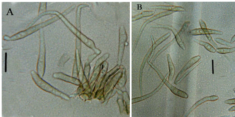
شکل ۲- Pseudocercospora mori : A. کنیدیوفور و کنیدیوم‌ها، B. کنیدیوم‌ها (مقیاس = ۳۰ میکرومتر). Fig. 2. Pseudocercospora mori : A. Conidiophores and conidia, B. Conidia (Bars = 30 µm).

لکه‌ها گرد تا زاویه‌دار، به قطر ۳-۱۵ میلی‌متر می‌باشند. کنیدیوفورها زیتونی کم‌رنگ تا قهوه‌ای تیره، خمیده تا سینوسی شکل، ساده، گاهی اوقات منشعب و به طول ۲۰-۹۰ و عرض ۲-۴ میکرومتر و با حدود ۲-۸ بند هستند. کنیدیوم‌ها بی‌رنگ تا به رنگ زیتونی روشن، واژ چماقی، تا استوانه‌ای شکل، نوک‌تیز، صاف تا خمیده و با ۳-۹ بند هستند. بندها به وضوح دیده نمی‌شوند، طول کنیدیوم‌ها ۴۰-۱۰۸ میکرومتر و عرض آن‌ها ۲-۴ میکرومتر تعیین شد. قبلاً این قارچ از روی Rubus sp. از ایران گزارش شده است.