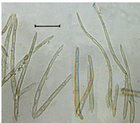
شکل ۳- Pseudocercospora rubi : کنیدیوم‌ها (مقیاس = ۲۰ میکرومتر). Fig. 3. Pseudocercospora rubi : Conidia (Bar = 20 µm).