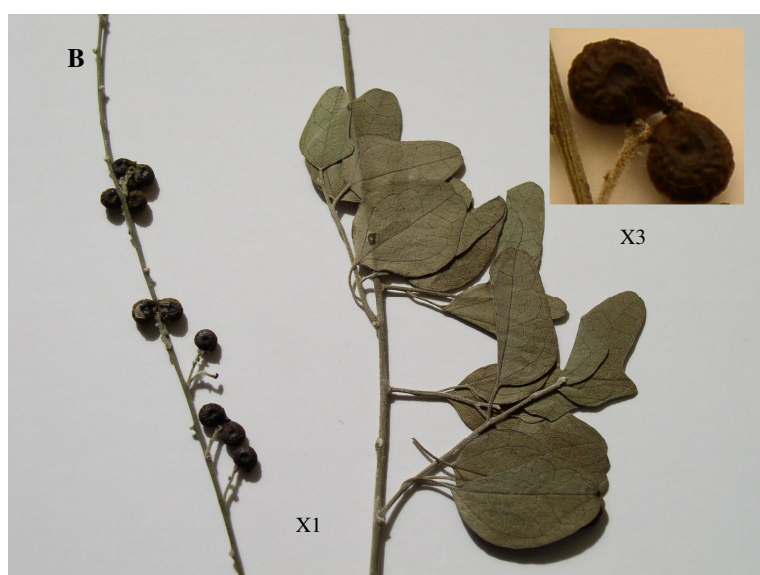
شکل 1- Cocculus hirsutus . A. گیاه نر، B. گیاه ماده. Fig.1. Cocculus hirsutus . A. Male plant, B. Female plant.